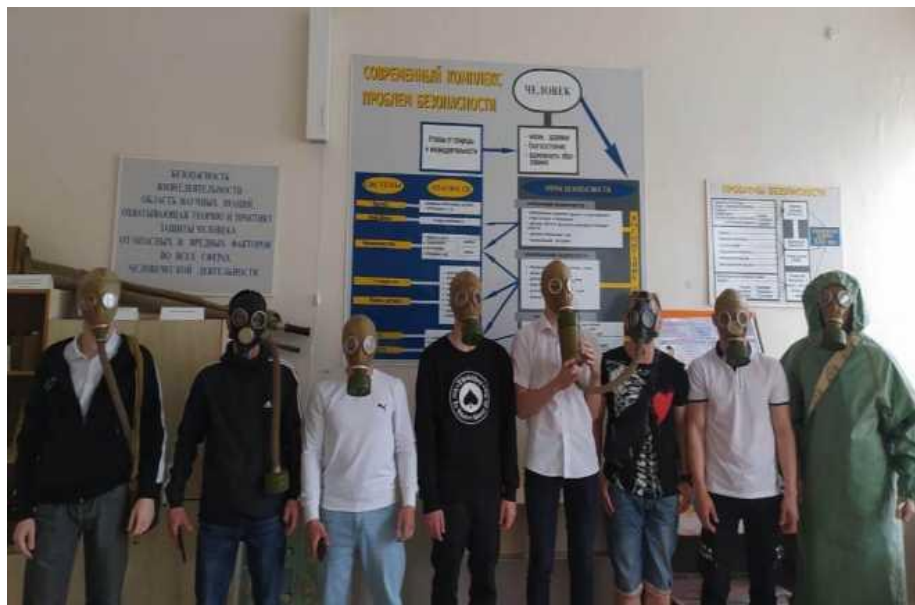
Использование средств индивидуальной защиты (ОЗК)