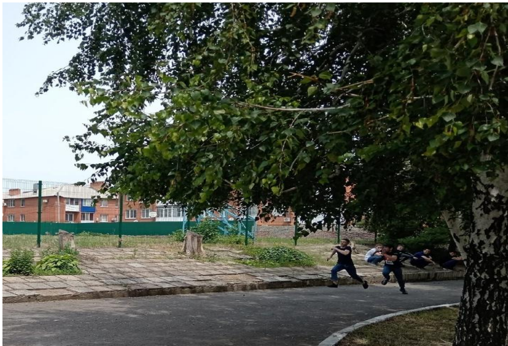
Сдача зачета по физической подготовке