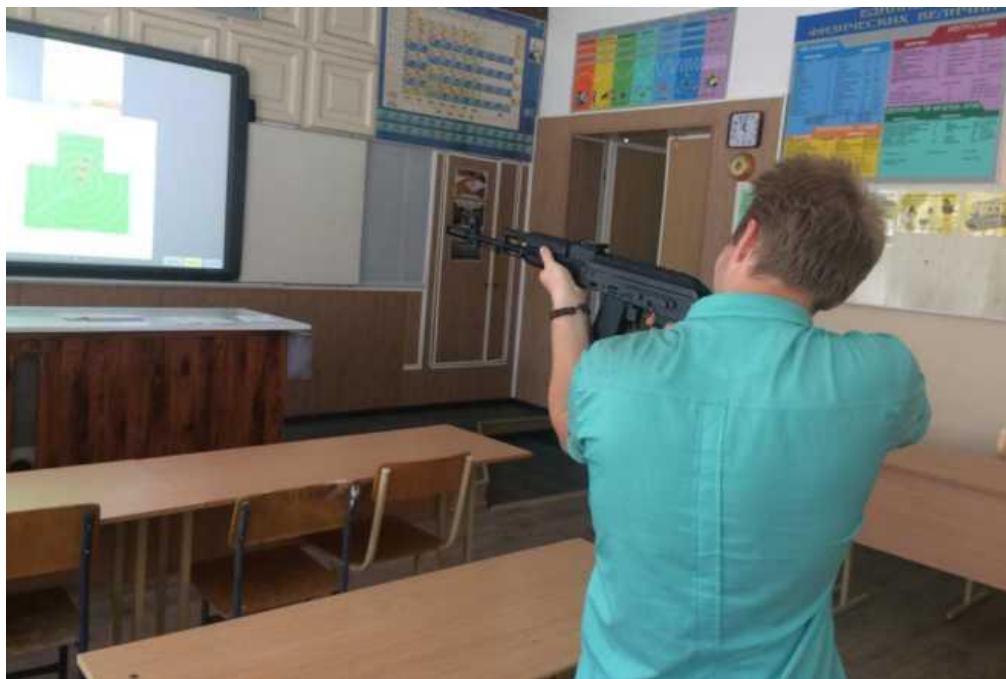
Практическое занятие по отработке приемов и правил стрельбы