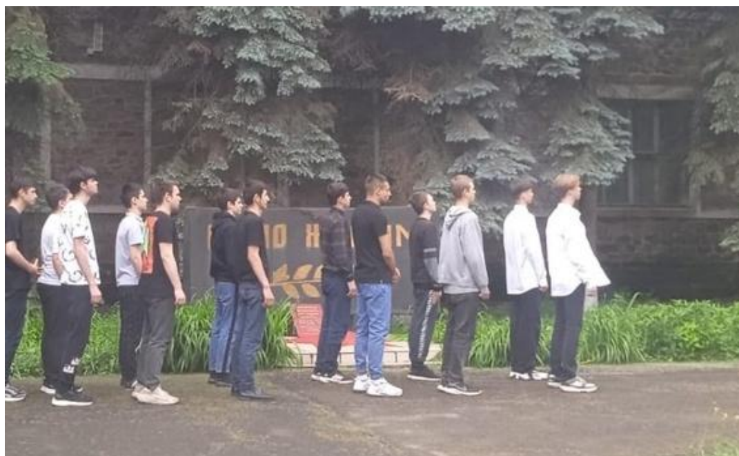
Построение, поворот на месте