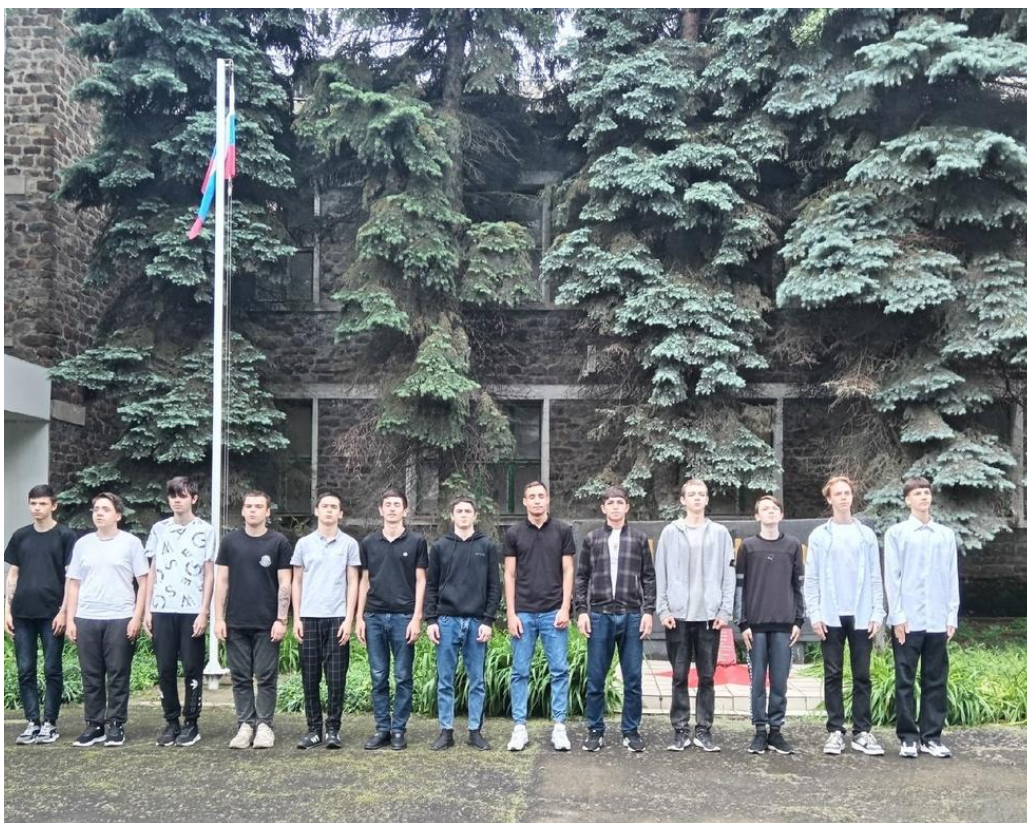
Строевая стойка и выполнение команд: «Становись!», «Равняйся!», «Смирно!»