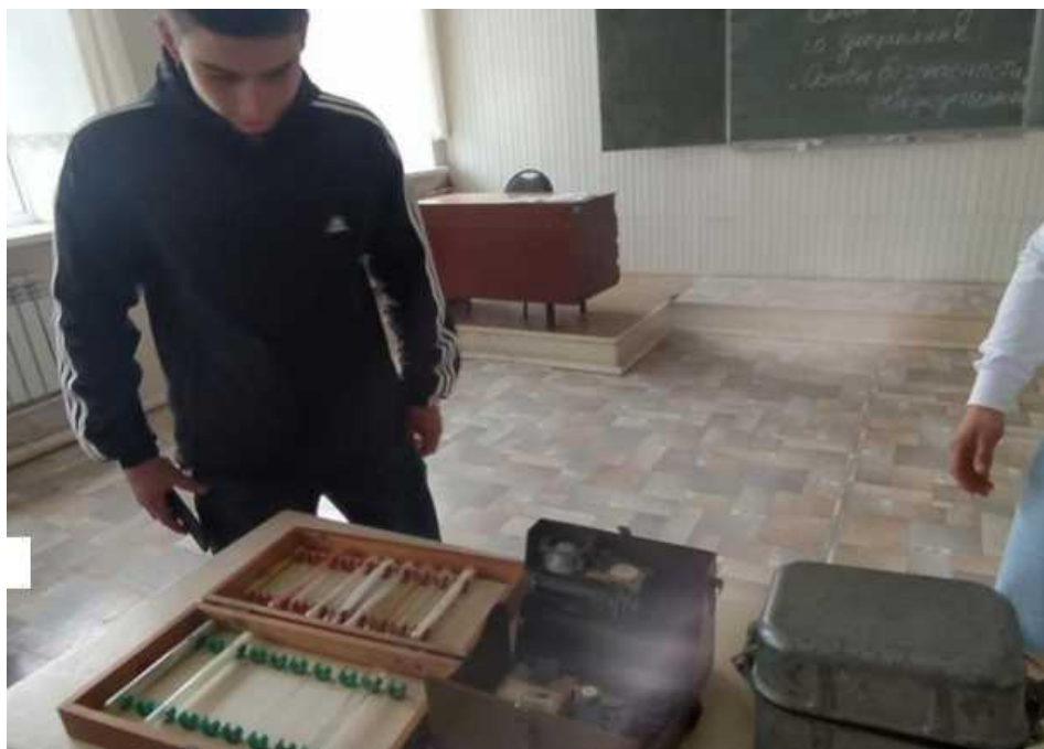
Работа с ВПХР