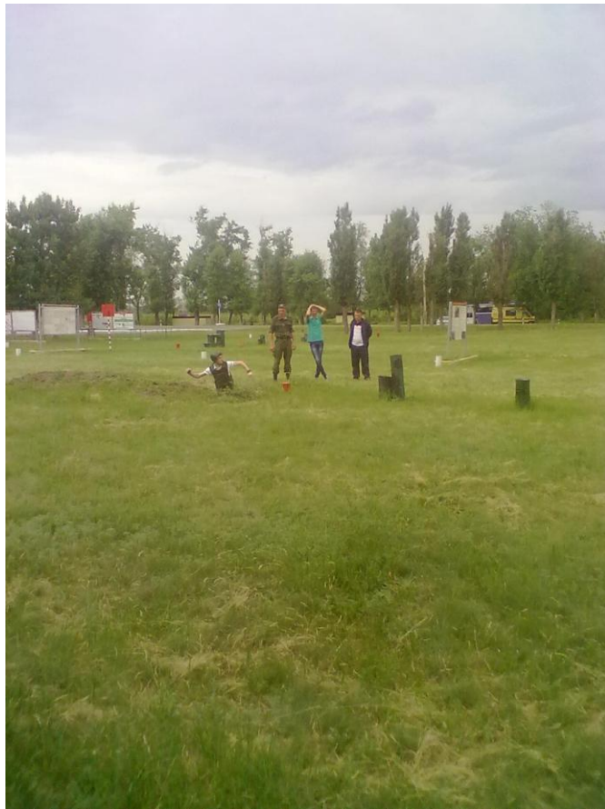
На огневом рубеже