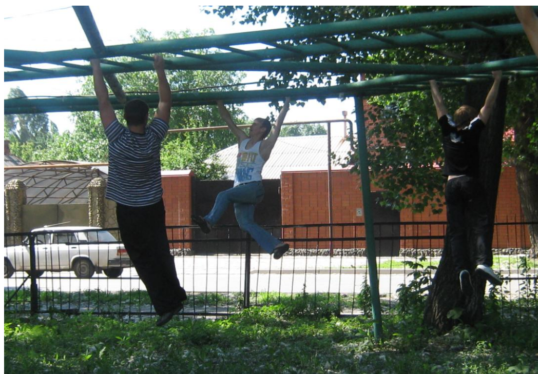
Преодоление полосы препятствий