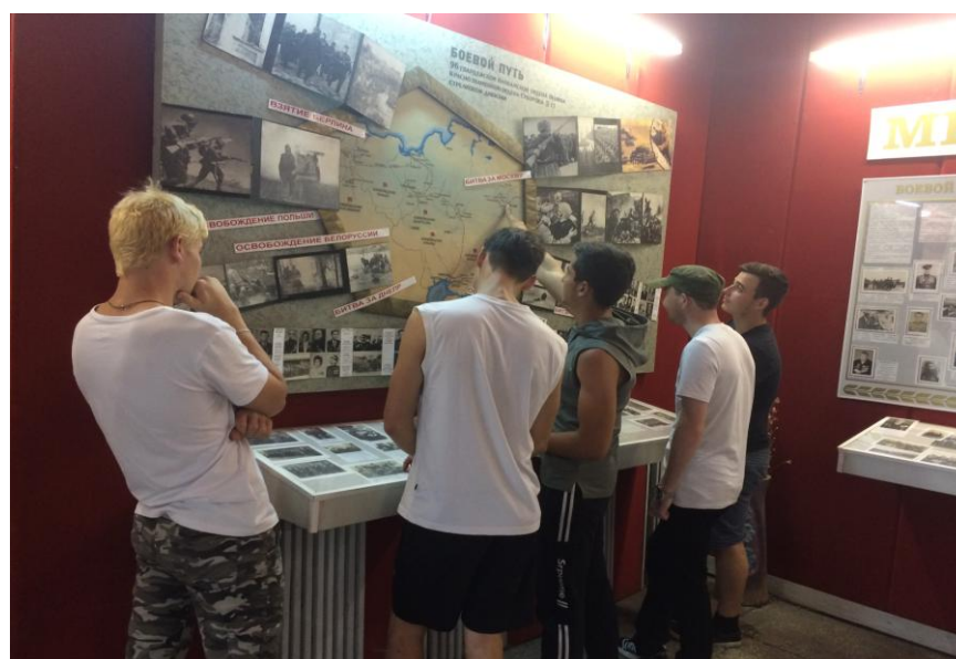
2. Посещение музея боевой и трудовой славы лица