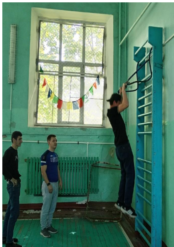
Сдача зачета по физической подготовке