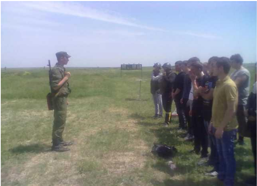
Теоретическое изучение приемов и правил стрельбы